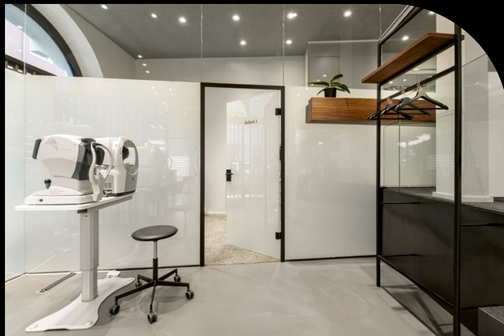
elektrisch matt geschaltet

Wir machen die Menschen glücklich. Wir sorgen für das Gefühl der Zeit.